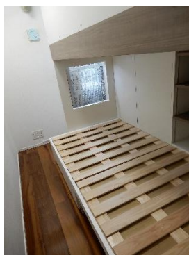
1階側ベッド、正面の開口は外の光を取り入れる