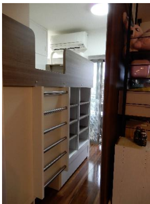
引き戸を開けると2階側のベッド 通路の巾は50cm