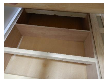
1階側ベッドの床下、半分は収納庫、 残りの半分は収納ケース入れスペース